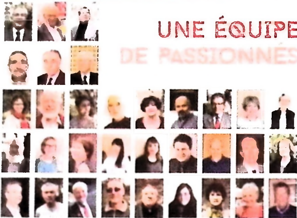
L'ÉQUIPE DE BÉNÉVOLES DE LA FONDATION DU PATRIMOINE