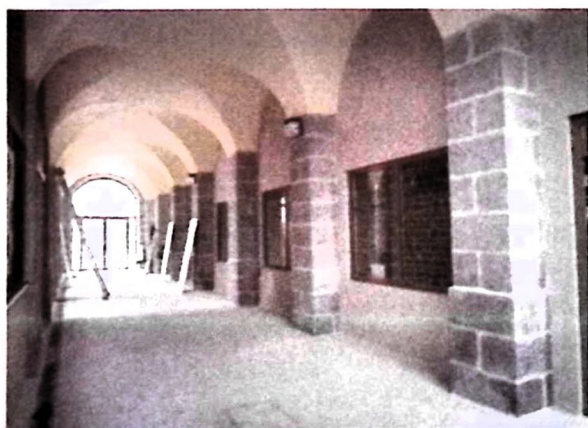
Maison de caractère à CROCQ