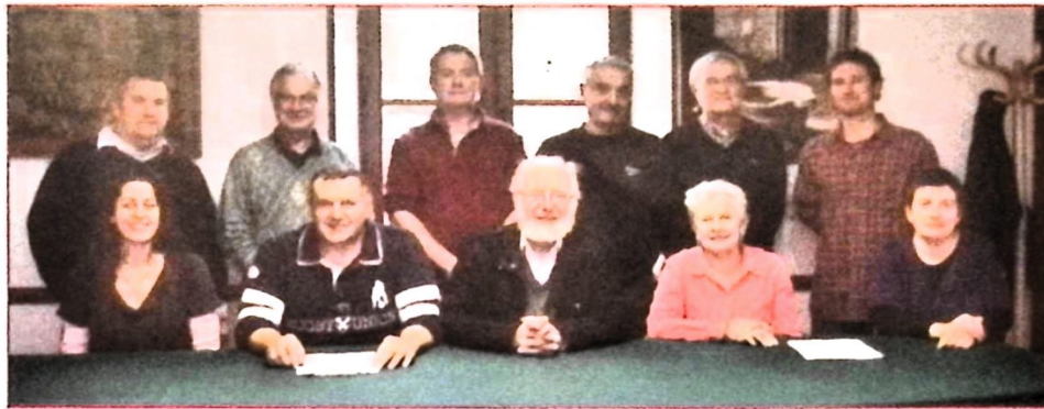
Le Conseil Municipal et les différentes commissions suite aux élections municipales