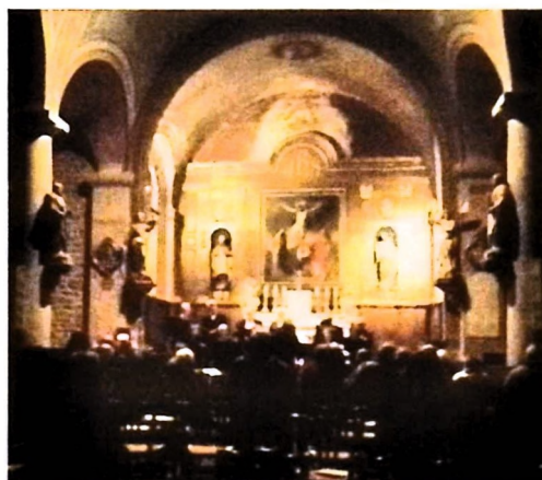
5 décembre - Association Culturelle Saint Eloi : à l'église Concert de Noël avec la chorale de Prondines.