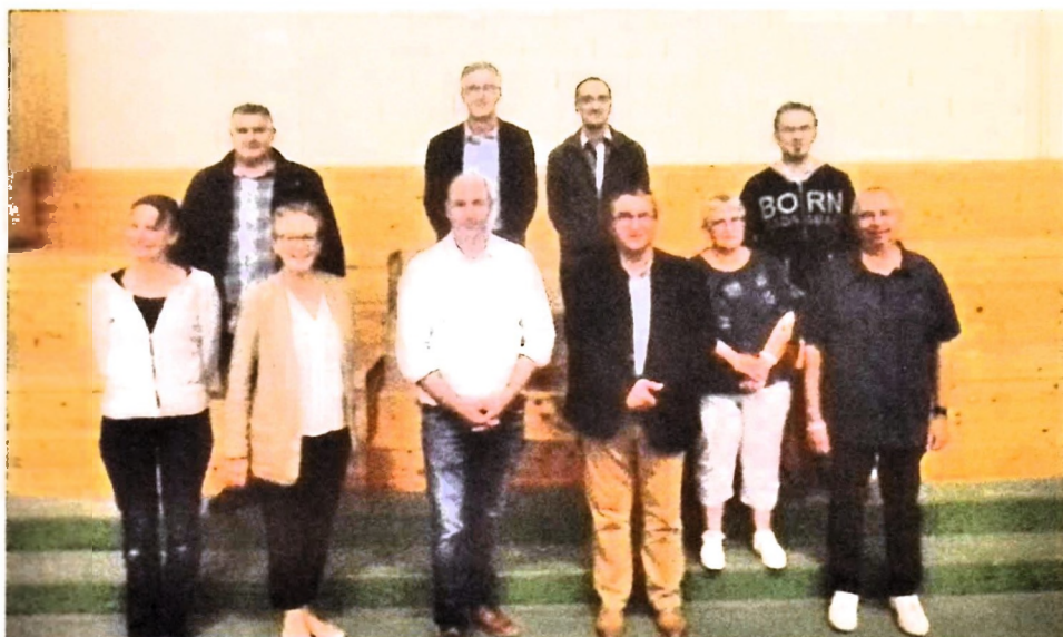
Le Président et les vice-président(e)s élus le 15 septembre 2021 :

Enfin, les élus communautaires vont travailler pendant le premier semestre 2022 à l'élaboration du « Projet de territoire ». Les cabinets d'études Citadia et Géolink, qui ont été retenus pour accompagner la collectivité, vont solliciter les acteurs du territoire pour établir un diagnostic complet et déterminer les axes de développement à privilégier.